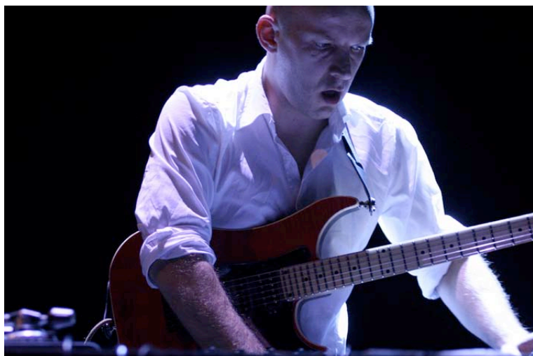
Push the Triangle

proposé par le Collectif Jazz de Basse-Normandie www.cjbn.fr