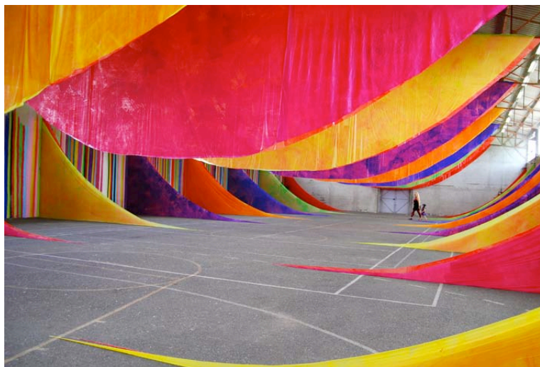
exposition au Gymnase d'Amance, dans le cadre d'une résidence au Frac Franche Comté en partenariat avec la résidence d'artistes Amalgame, juillet 2009, bâches plastiques, peinture murale, acrylique, 40 x 20 x 6,5 m