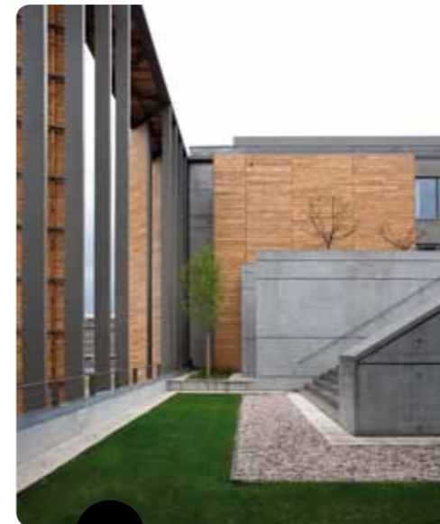
A. Aublet DNAP caen 2009 photo M.Gottstein, ésam Caen