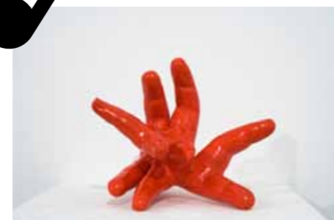
L.Combat DNAP art 2009 photo M.Gottstein, ésam Caen

L'ésam accueille actuellement 250 étudiants, l'admission s'effectuant sur concours d'entrée ou en cours de cursus après passage devant une commission. L'enseignement s'y articule autour de cours magistraux, de la pratique des différents moyens d'expression en ateliers, de workshops, de recherches personnelles et de stages professionnels. Il est assuré par une équipe pédagogique qui associe 25 enseignants issus des champs théoriques et des champs pratiques. Il s'agit d'artistes ayant une pratique reconnue dans le domaine de la création contemporaine et dont les activités professionnelles représentent un large échantillon de compétences et de domaines d'interventions. Les ateliers techniques sont par ailleurs encadrés par 13 techniciens spécialisés.